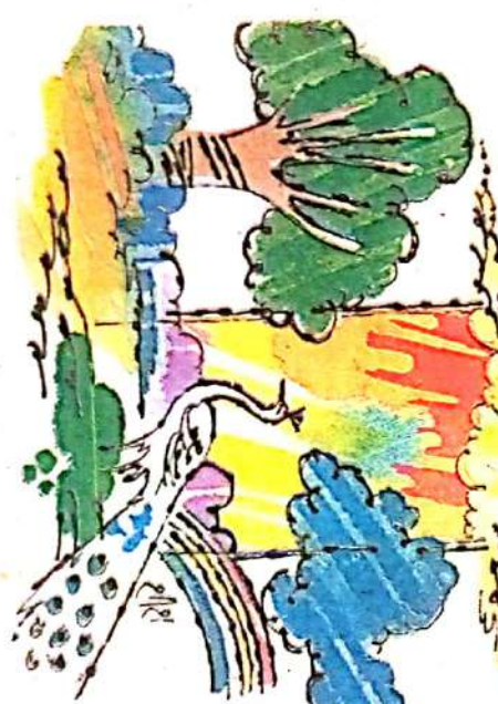
चित्र : शीतल शहाणे

बालकवींनी कितली कविता लिहिल्या आहेत. 'चिख-चिख मं चिपणू ताई, बोल घाई बोल मं, तुझ्या बोलोचे काय वाणू मंजूर मं, आई-आई, चांदीचा पत्रला देई,